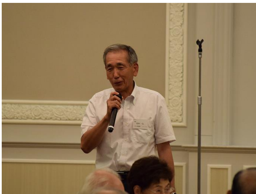
来賓(恩師)あいさつ