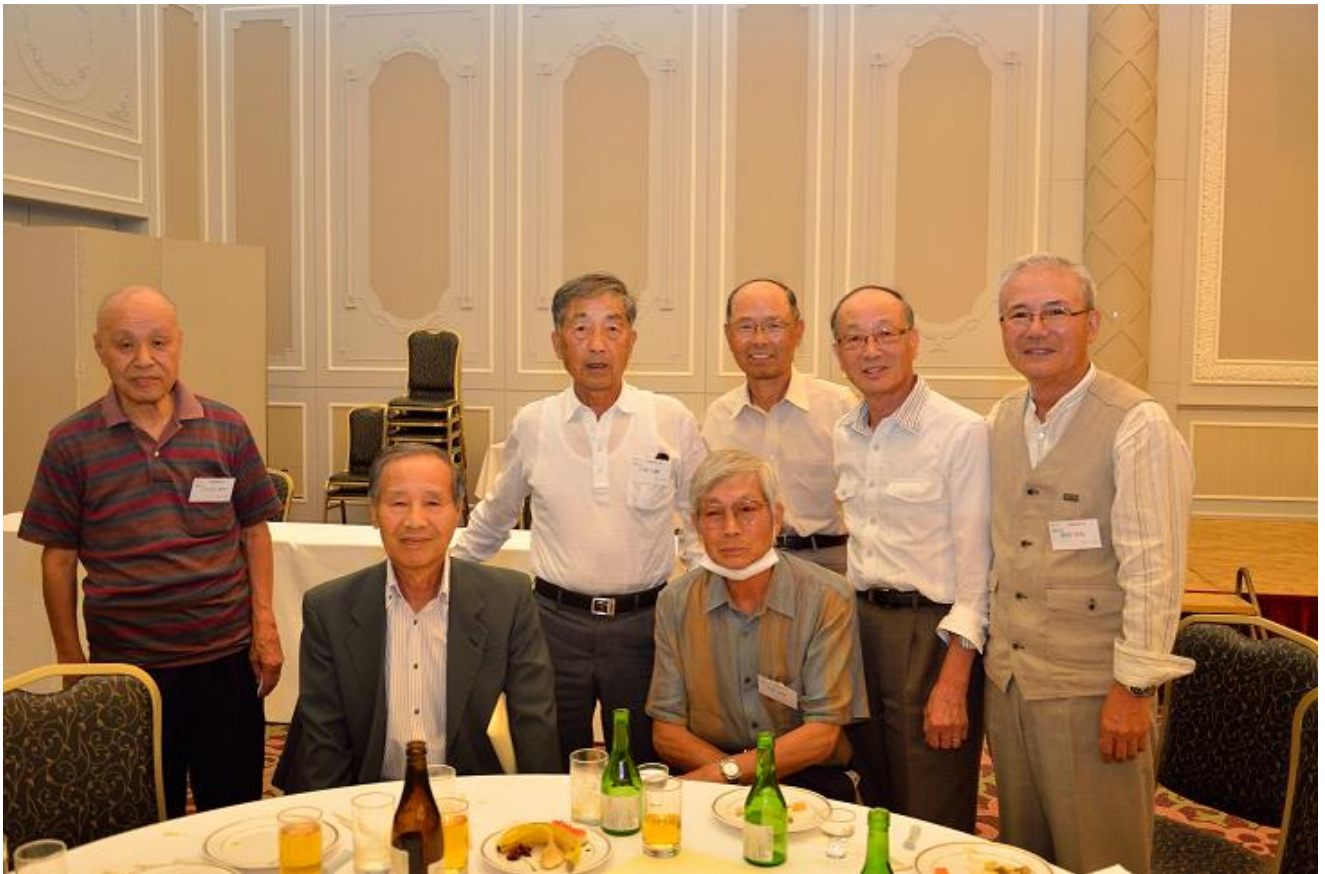
天竜林業高校卒業生の皆さん