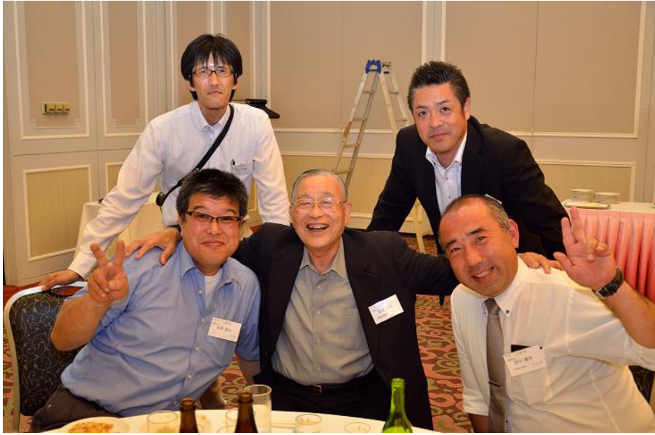
二俣高校卒業生の皆さん