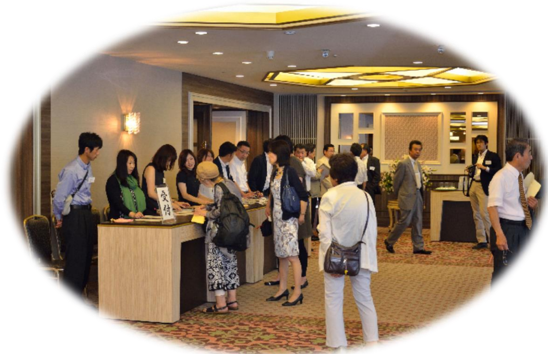
総会・懇親会受付風景