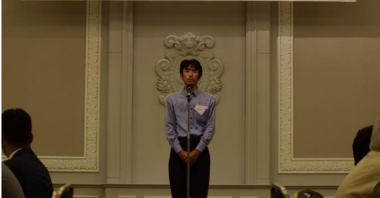
懇親会での実行委員長(年次代表)あいさつ