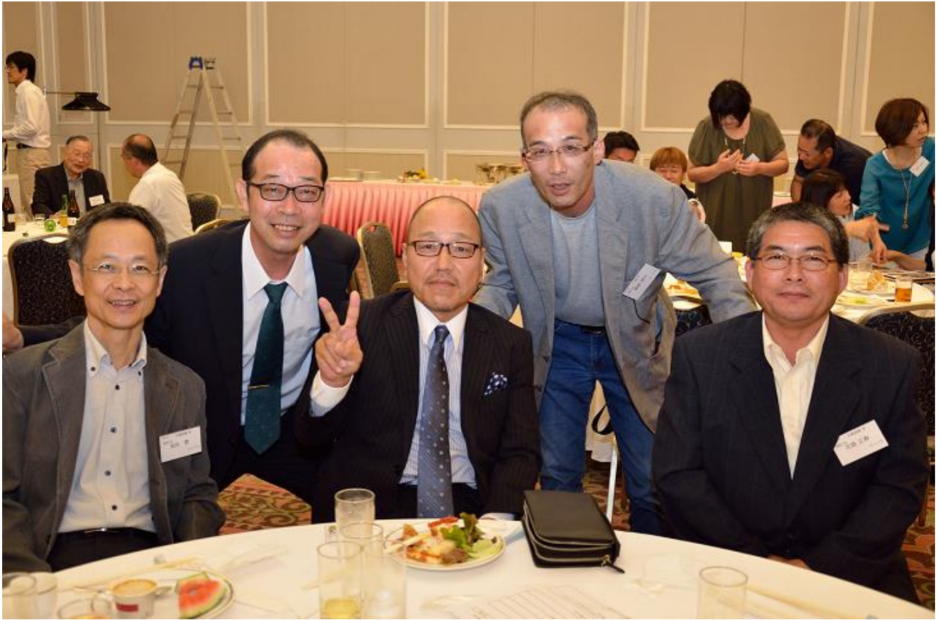
同年代の天竜林業・二俣高校卒業生の皆さん