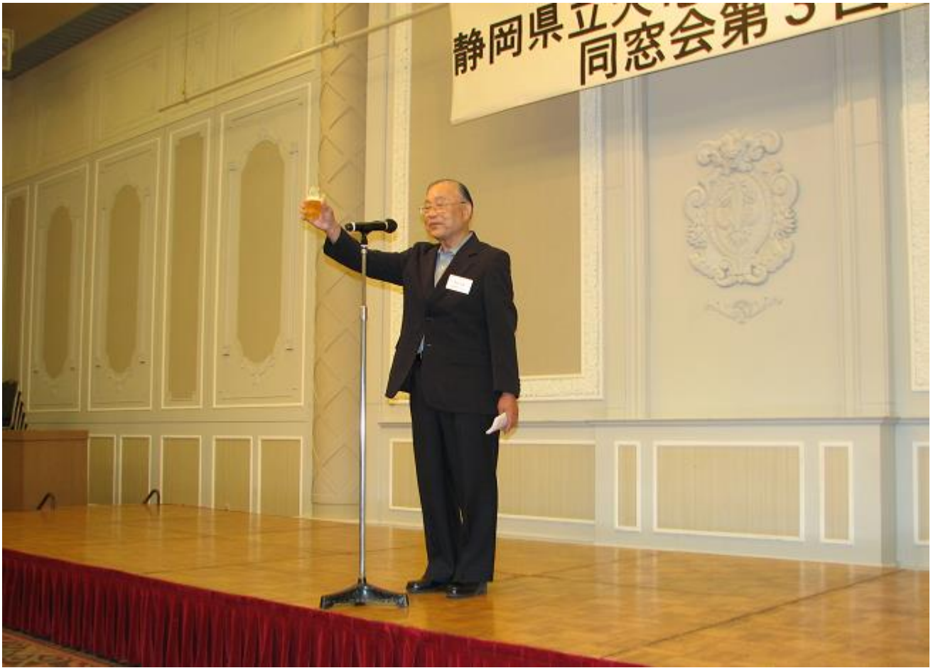
乾杯(天竜高校後援会理事長)