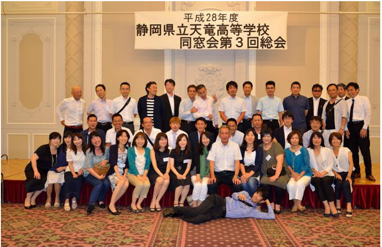
今年度中心年次の皆さん(恩師を囲んで)