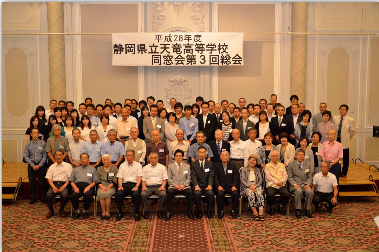
総会・懇親会出席者集合写真