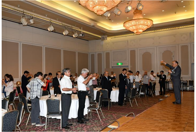
乾杯(天竜高校後援会理事長)