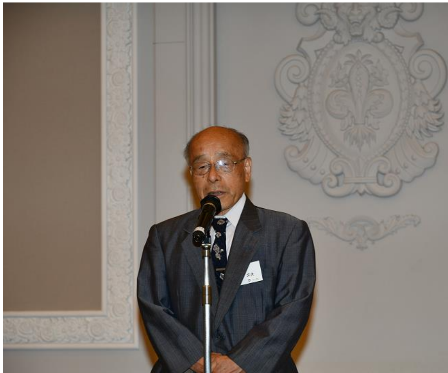
来賓(恩師)あいさつ