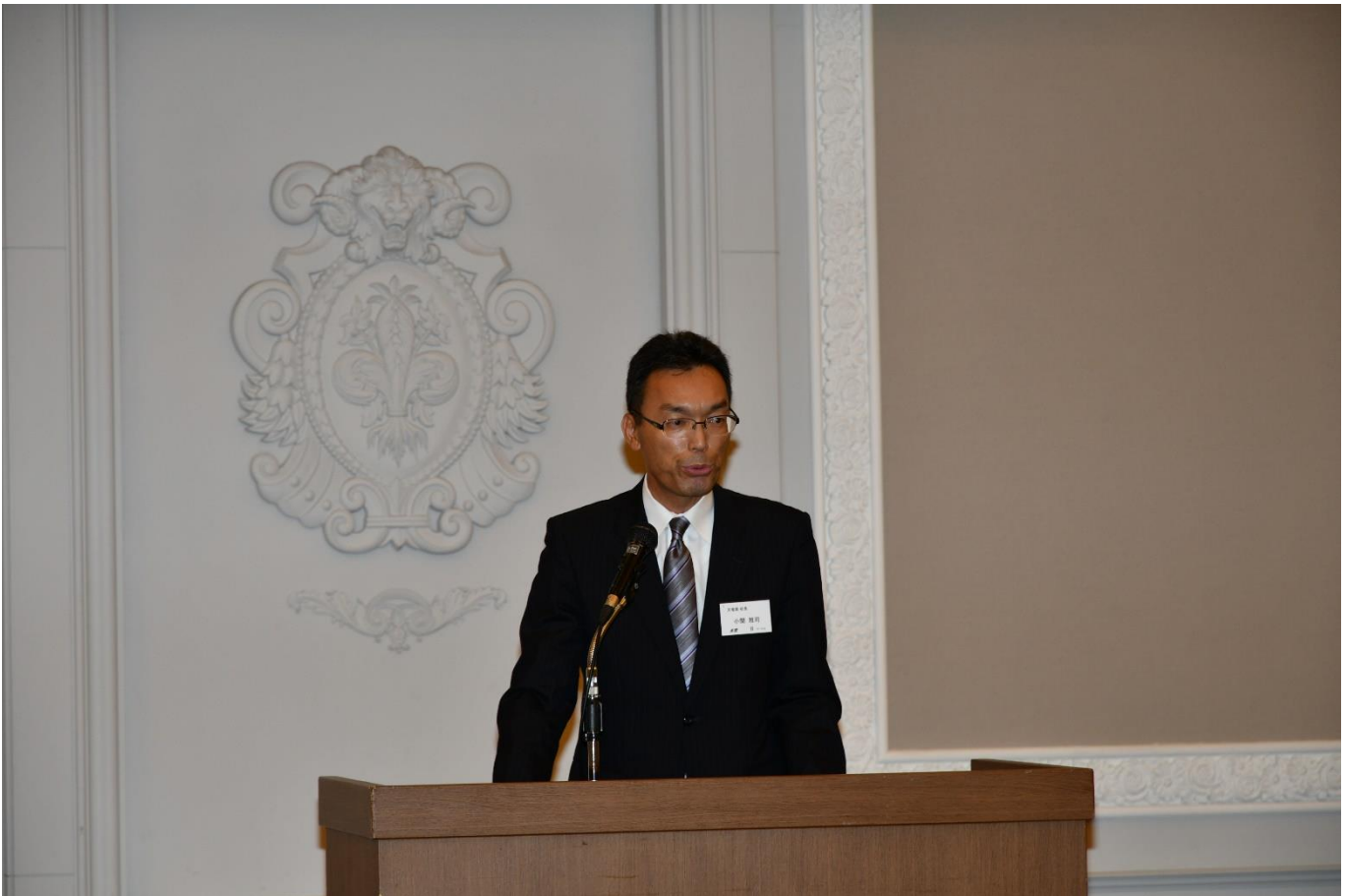
天竜高校校長あいさつ