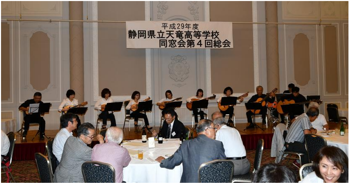
ビバ・マンドリーノ天竜の演奏