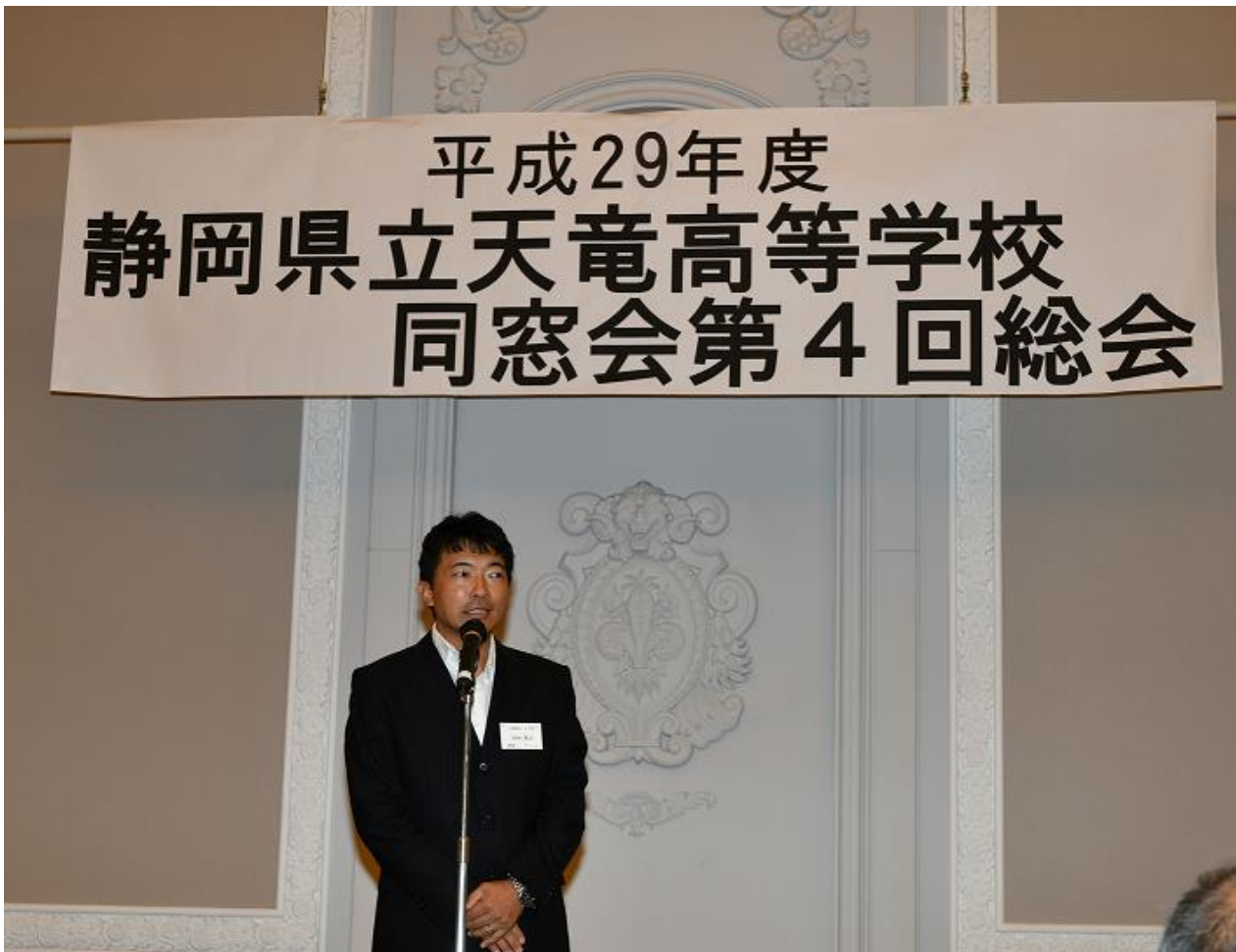
懇親会での実行委員長(年次代表)あいさつ