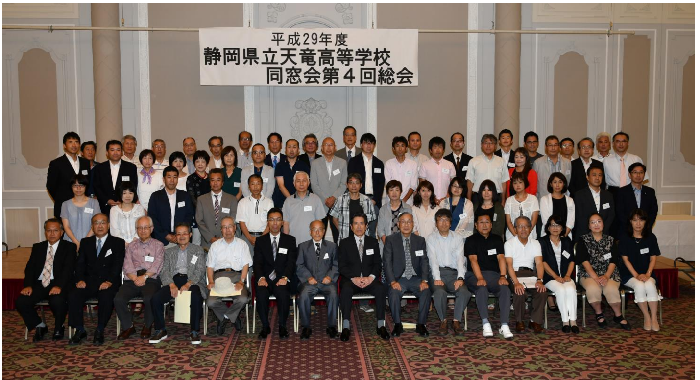
総会・懇親会出席者集合写真