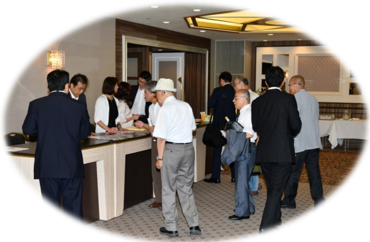
総会・懇親会受付風景