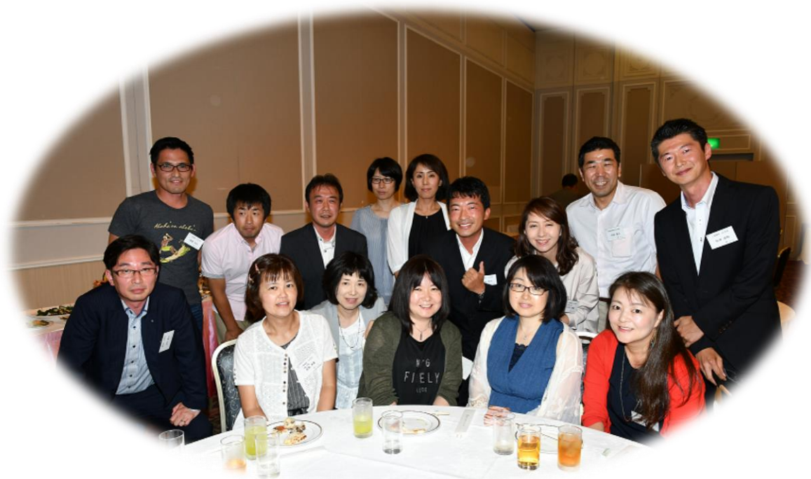
今年度中心年次の皆さん