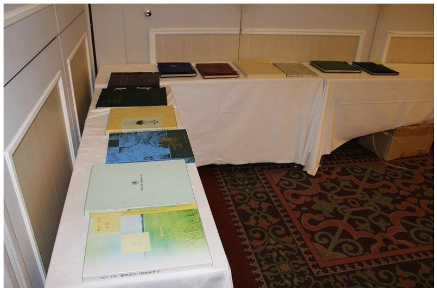
各校の卒業アルバム