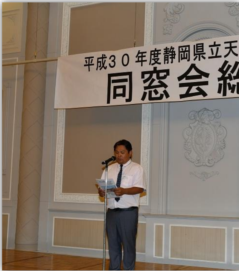
懇親会での実行委員長(年次代表)あいさつ