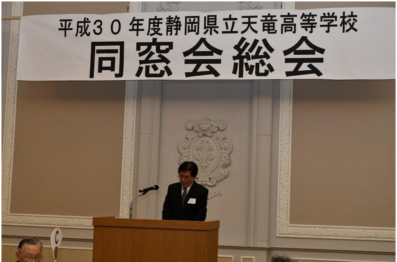
同窓会長あいさつ