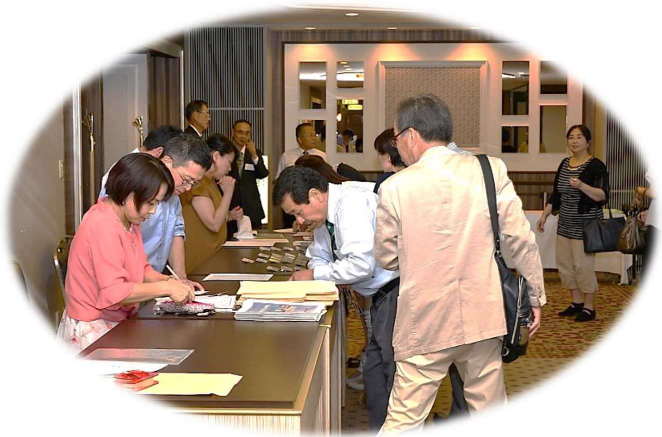
総会・懇親会受付風景