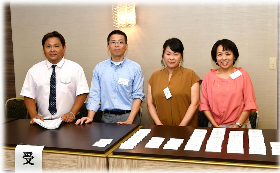
受付メンバー(実行委員)