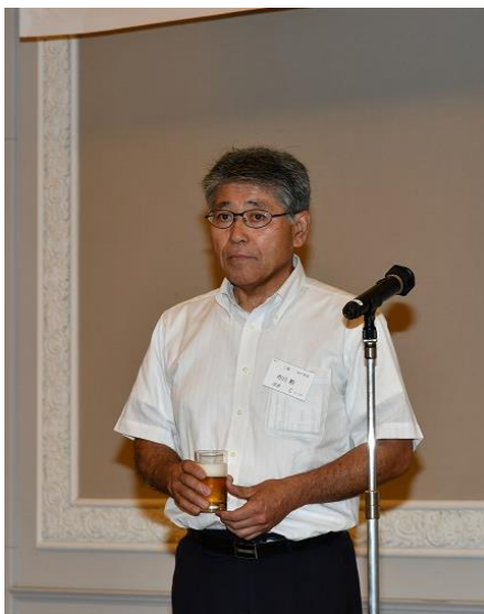
乾杯(天竜高校後援会理事長)