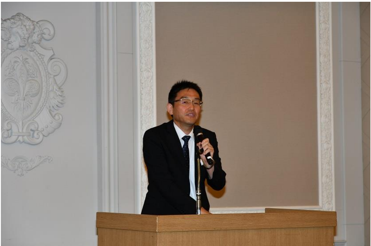
天竜高校校長あいさつ