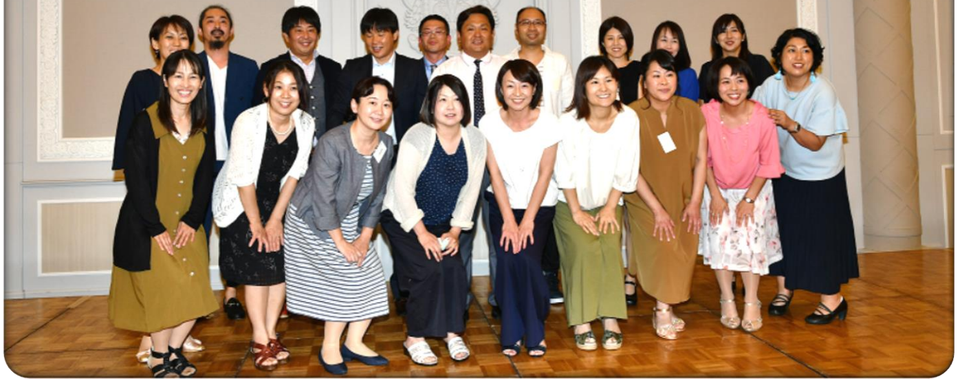
今年度中心年次の皆さん