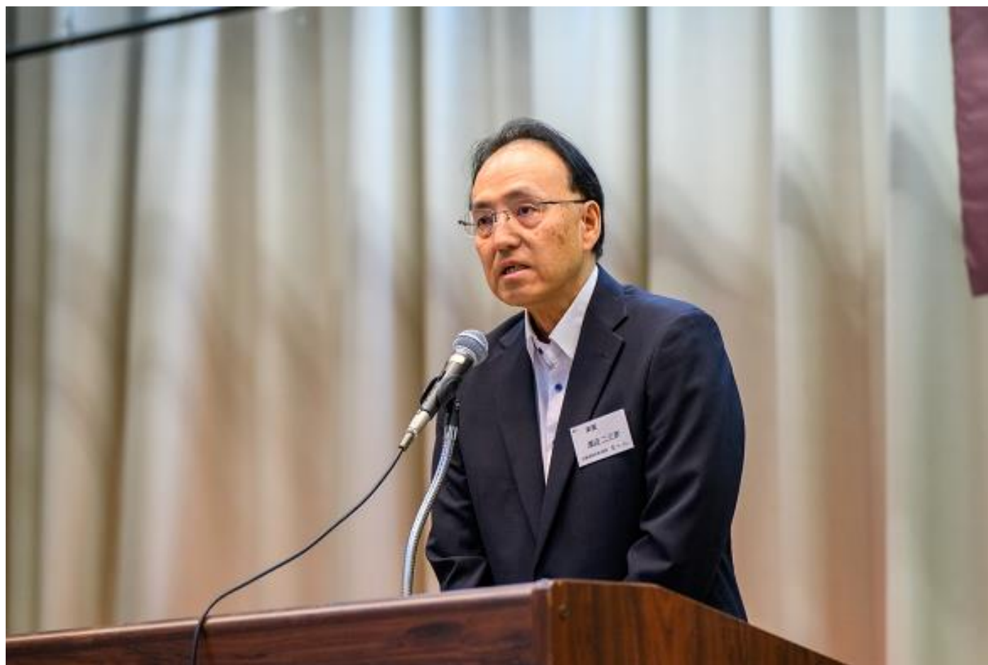
天竜高校校長あいさつ