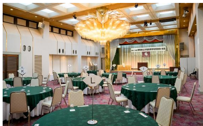
開会前の会場風景