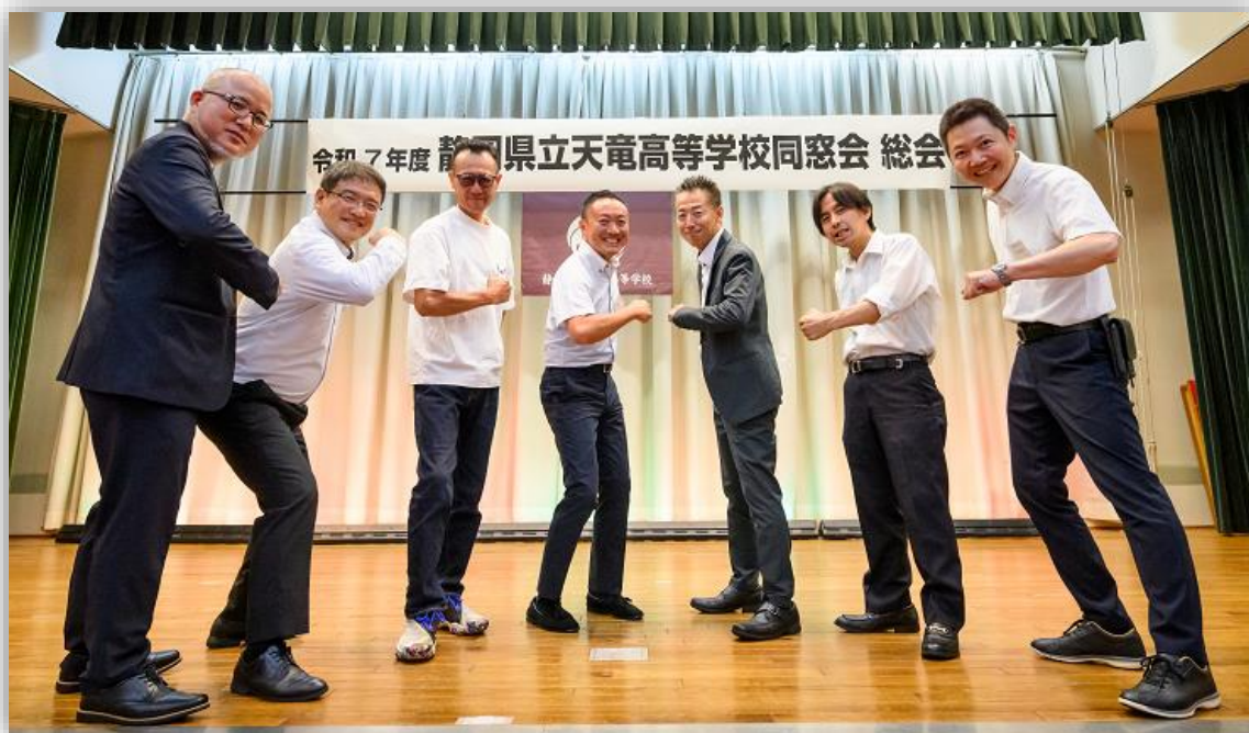
今年度中心年次の皆さん