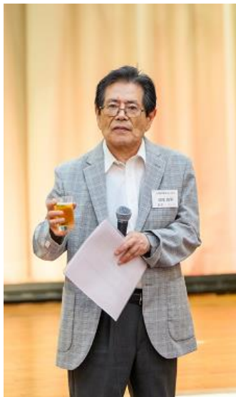
乾杯(天竜高校後援会副理事長)