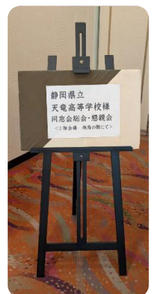
総会・懇親会受付風景