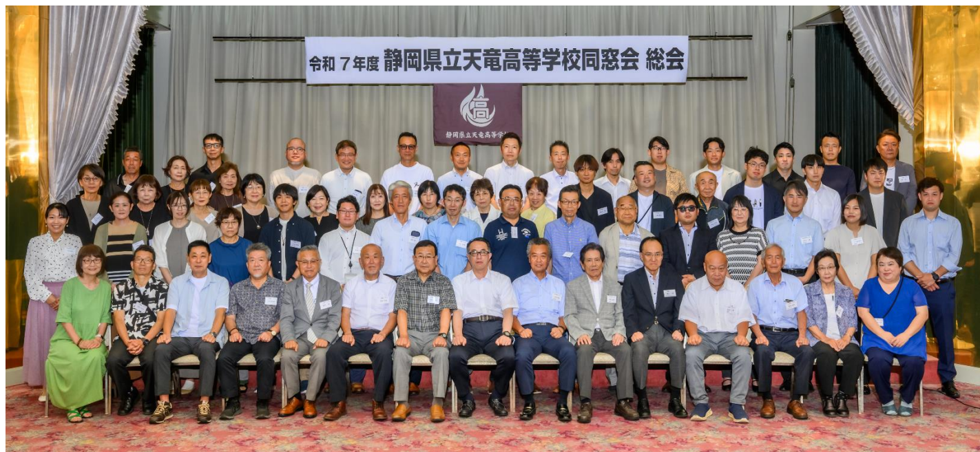
総会・懇親会出席者集合写真